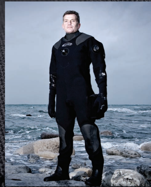
Locatie: Portland Bill, UK. Uitvalsbasis voor de beste duikgebieden in de UK.

Voor meer informatie ga je naar othree.co.uk