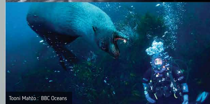
Tooni Mahto : BBC Oceans